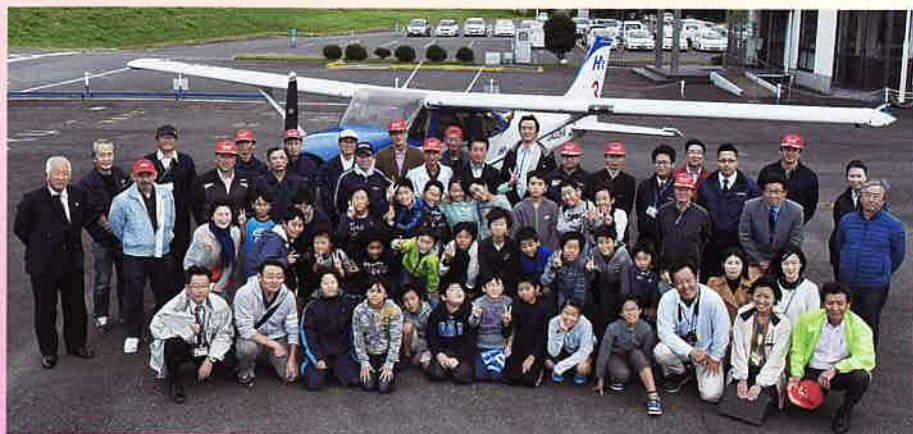
29 日全体写真！ この日は 30 kt 近くの強い風が吹いていました。