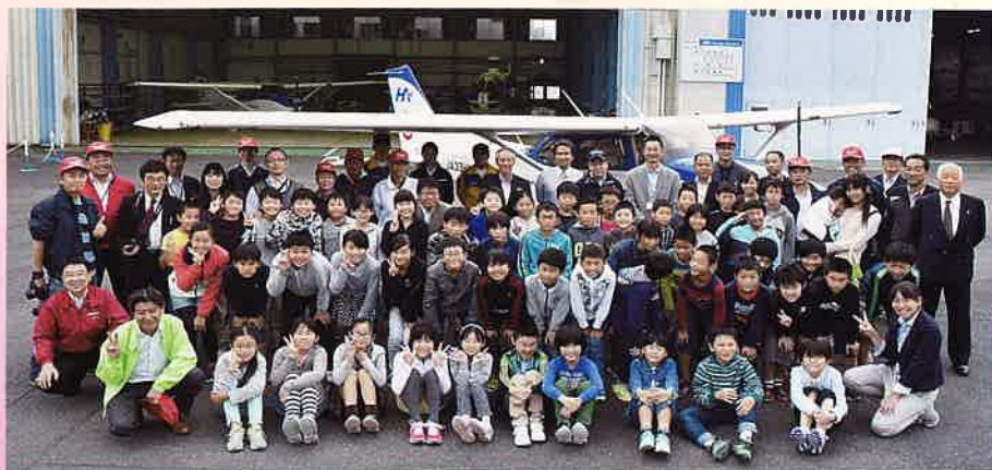
22 日全体写真！ 50 名を超える児童で盛り上がりました。