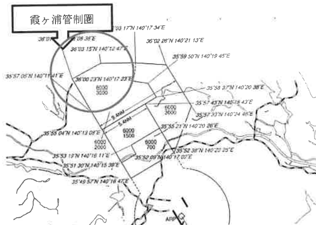
霞ヶ浦管制圏付近の PCA