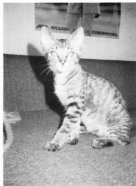
▲ふたごのコネコが生まれました。もらって下さる方募集中！

さて、この度はクラブカードに多数ご加入頂きまして、ありがとうございます。おかげ様で、今後の会費収入等スムーズになる事が予測されます。又、これを会員の皆様に還元させ、より楽しいクラブ作りに役立てたいと存じます。