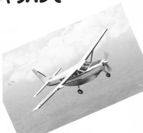
世界最大の単発機セスナ208 “キャラバン”

ホンダエアポートのセスナ208ことキャラバンの数が、最近増えたのにお気づきでしょうか。昨年夏日本中を駆け巡ったSNJ-2のかわりにこの度キャラバンでスカイメッセージを実施するためです。5機のキャラバンが桶川をホームベースにして本田航空の操縦士により高度1万フィートに巨大なメッセージを浮かびあがらせ、この夏の問題をまたさらいそうです。それにしてもあのキャラバン5機の離着陸は迫力ありそうですね。どうぞお楽しみに。