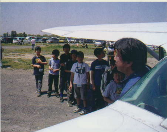
翼の日陰で順番待ち

ジュニアウイングス航空教室をいたしました。これは航空先進国アメリカなどで、展示飛行の後にプログラム後半には、エプロン開放時間を設け、子供たちにパイロットから説明を受け、実機に実際に見て触って楽しんでもらうことをモチーフにしているものです。子供が主役ということで、私達もそこに視線を合わせ、彼らにコクピットに乗ってもらいそこで説明して、操縦桿などを動かしてみるものです。（フライトはせずに、ブースに駐機してあるC-172を使用）そこで操縦席に座った写真を撮り、写真付き講習修了書を後ほど差し上げます。（子供の集中力もあるので、約30分くらいで終了。今回は、オリジナルシャープペンシルもセット。+αで、本田宗一郎自伝秘話、飛行機Q&Aといった冊子も挿入いたしました。）