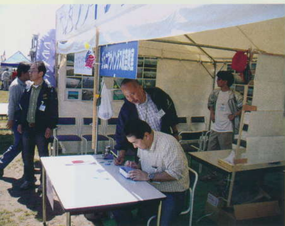
作業分担もカンペキ！

ジュニアウイングス航空教室をいたしました。これは航空先進国アメリカなどで、展示飛行の後にプログラム後半には、エプロン開放時間を設け、子供たちにパイロットから説明を受け、実機に実際に見て触って楽しんでもらうことをモチーフにしているものです。子供が主役ということで、私達もそこに視線を合わせ、彼らにコクピットに乗ってもらいそこで説明して、操縦桿などを動かしてみるものです。（フライトはせずに、ブースに駐機してあるC-172を使用）そこで操縦席に座った写真を撮り、写真付き講習修了書を後ほど差し上げます。（子供の集中力もあるので、約30分くらいで終了。今回は、オリジナルシャープペンシルもセット。+αで、本田宗一郎自伝秘話、飛行機Q&Aといった冊子も挿入いたしました。）