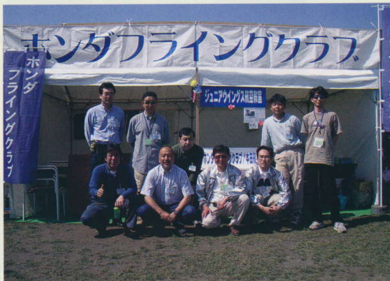
みごとなチームワーク お疲れさまでした