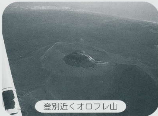
登別近くオロフレ山