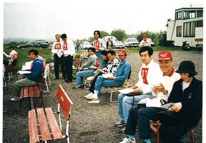
にっこりハイチーズ