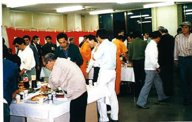
なごやかな前夜祭風景