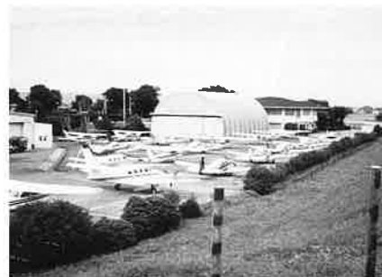
水のたまったエプロン