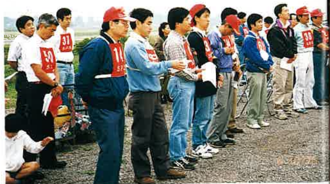
大会説明を聞くみなさん