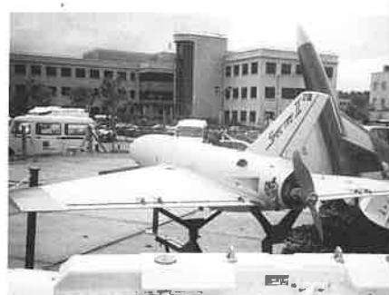
標的機 3 種