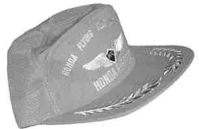
▲ホンダフライング帽子