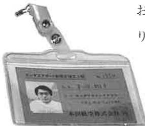
▲ホンダエアポート制限区域立入証