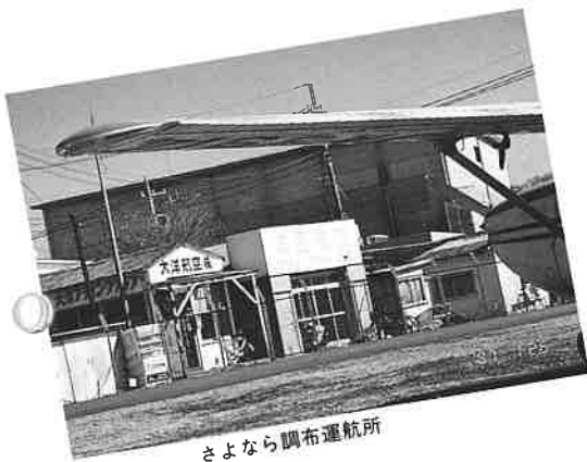
さよなら調布運航所