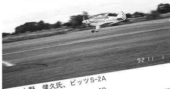
▲上野 健久氏、ピッツS-2A ▼富士重工・三浦氏、KM-2D